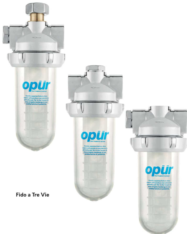
Fido a Tre Vie