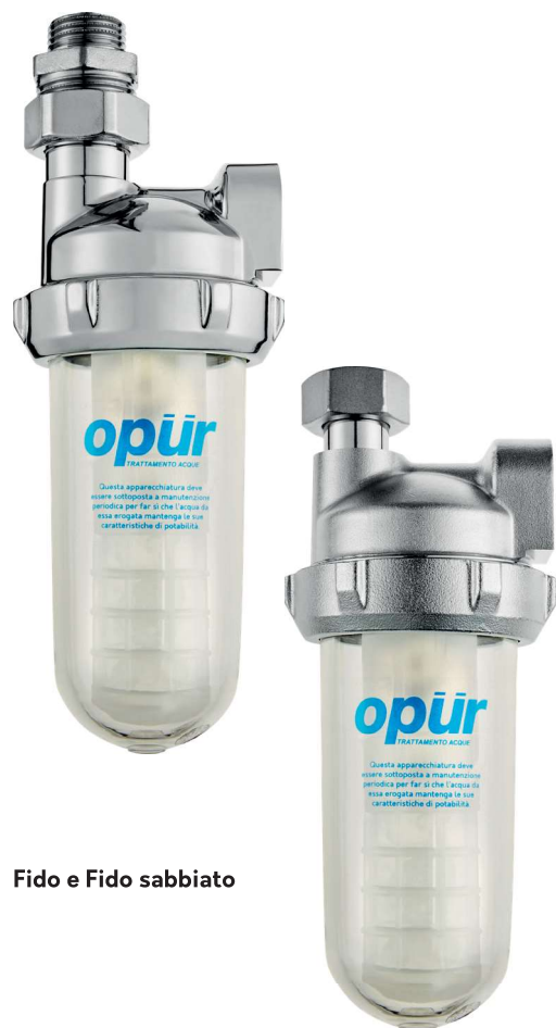
Fido e Fido sabbiaato